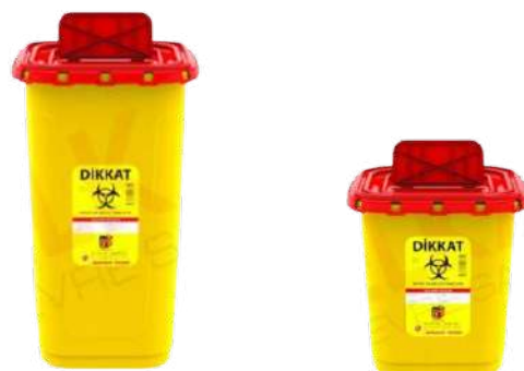
Контејнер за медицински отпад