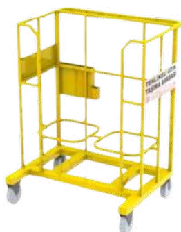
Количка за транспорт на опасен отпад