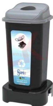
Модуларна корпа за ракавици и маски