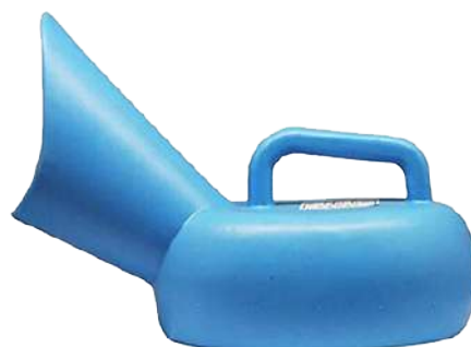
Гуска ПВЦ 1000ml женска