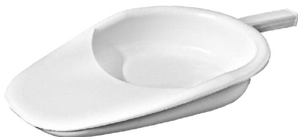
Лопатка за жени пластична