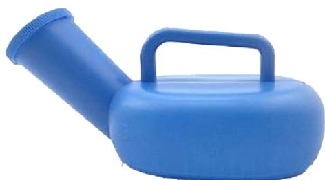
Гуска за урина машка